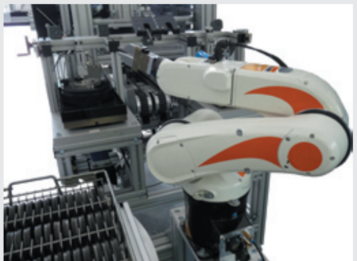
Prüfstation mit Roboter