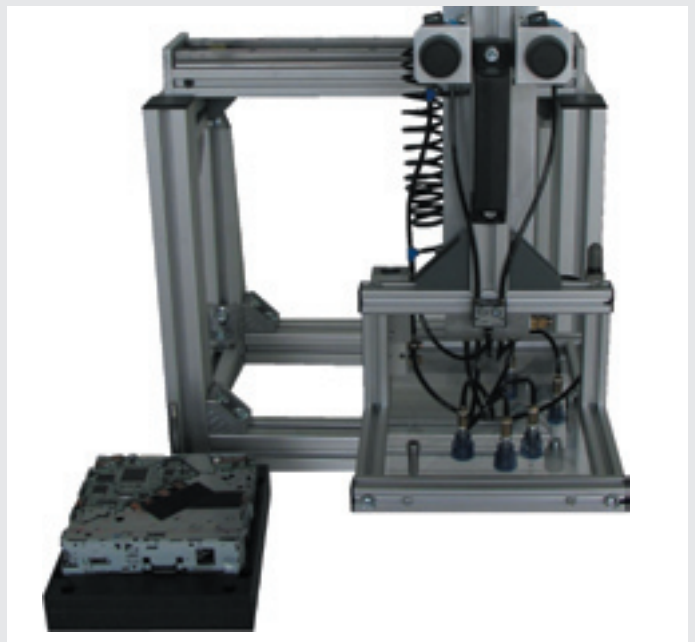
Handlingsystem für Laufwerkmontage